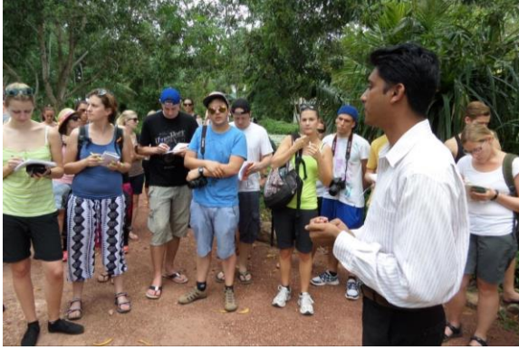
Studenten im Coconut Research Institute, Sri Lanka