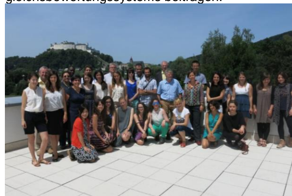
Gruppenfoto Summer School in Salzburg