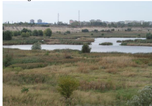
Vacarest-Gebiet – Ungenutzter Freiraum in Bukarest

Es wurden während Geländearbeiten zur Stadtökologie Grundlagen für eine Forschungs-kooperation erarbeitet. Schwerpunkt darin soll ein Projekt zur Entwicklung eines bisher ungenutzten Freiraums mitten in Bukarest sein. Dieses Vaca-rest-Gebiet stellt eine Hinterlassenschaft der Ceausescu-Zeit dar und könnte ein künftiger Schwerpunkt ökologischer Stadtentwicklung in Bukarest werden. Dazu ist die Kooperation mit der Stadtverwaltung vorgesehen. Das Projekt soll 2015 beginnen.