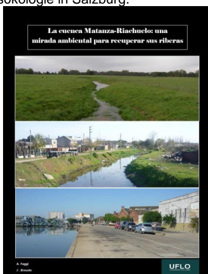
Handbuch für eine nachhaltige Entwicklung der Ufer des Rio Matanza-Riachuelo